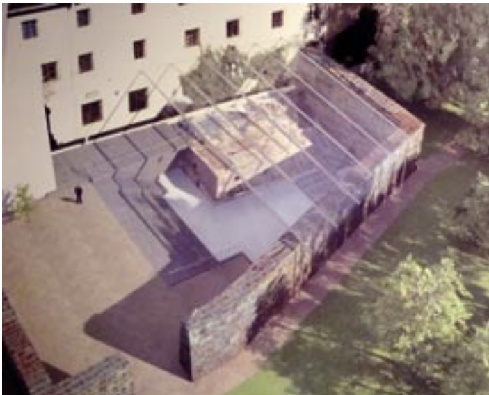
Entwurf für die Überdachung des Anbaus am Lutherhaus der Architekten Tillner & Willinger aus Wien.

Zum dauerhaften Erhalt des Denkmals ist, wie eingehende Untersuchungen gezeigt haben, eine beständige Überdachung vonnöten. Die Stiftung Luthergedenkstätten hat deshalb mit Unterstützung der Sachsen-Anhaltinischen Entwicklungsgesellschaft (SALEG) einen Architektenwettbewerb zur Überdachung des Anbaus ausgerufen. Gefunden werden sollte eine Überdachung, die sowohl den Schutz vor Witterungseinflüssen gewährleistet, als auch die Sicht- und Erlebbarkeit des Anbaus ermöglicht. Ein weiteres wichtiges Kriterium war der denkmalpflegerische Anspruch im Kontext des UNESCO-Weltkulturerbestatus des Lutherhauses. Gewonnen hat das Architekturbüro Tillner & Willinger aus Wien, die die Überdachung denkbar einfach gelöst haben. An das Lutherhaus wird sich ein Dach anschließen, das zur Südseite der ehemaligen Stadtmauer führt. Gebaut wird ein sogenanntes Folienkissendach aus Ethylentetrafluorethylen (ETFE)-Folie. Dieses Material wurde unter anderem auch bei der Allianz-Arena in München verbaut. Große Vorteile sind eine hohe Transparenz und ein geringes Materialgewicht. Die Jury lobte den Entwurf der Architekten Tillner & Willinger als »eine architektonisch überzeugende Lösung, die zugleich mit dem Baudenkmal sensibel umgeht.« Die Überdachung soll bis Frühjahr 2010 realisiert werden.