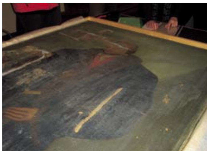
Das zerstörte Gemälde wurde vor dem Transport in die Restaurierungswerkstatt nach Dresden Medienvertretern präsentiert.

Was ist mit dem Gemälde, das aus der zweiten Hälfte des 16. Jahrhunderts stammt und Lucas Cranach d.J. zugeschrieben wird, passiert? Über die genauen Umstände kann nur spekuliert werden. Die massiven Schäden sind vermutlich in den letzten Kriegstagen, während der anarchischen Zustände nach dem Einmarsch der Roten Armee in Wittenberg, im Mai 1945 entstanden. Die Risse und Schnitte sind auf jeden Fall Zeichen einer mutwilligen Zerstörung. Die Mitarbeiter der Stiftung haben versucht, die Geschichte des Bildes zu rekonstruieren und dabei einige spannende Fakten zusammengetragen. Ursprünglich befand sich das Bild zusammen mit einem ebenfalls lebensgroßen Porträt Martin Luthers im Besitz der Universität Wittenberg. Ab 1842 dürfte das Melanchthonbild in der ersten Etage des Lutherhauses ausgestellt worden sein. In diesem Jahr ist das Porträt im Inven-