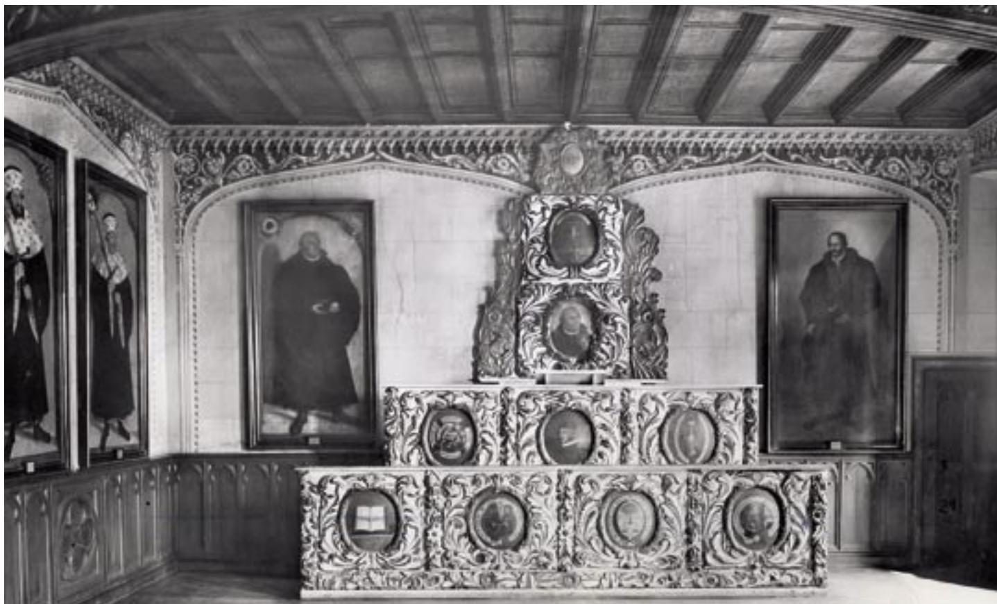
Die Aufnahme (um 1900) zeigt den großen Hörsaal, mit den beiden lebensgroßen Porträts von Martin Luther und Philipp Melancthon. Das Lutherbildnis gilt bis heute als verschollen.

ses. Dies zeigen Fotografien aus den 1920er und 1930er Jahren. Nach 1945 konnten die beschädigten Bilder nicht mehr ausgestellt werden, sie wurden auf dem Dachboden des Museums gelagert.