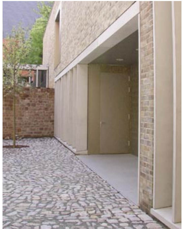
Mehrfach ausgezeichnet: das Luthergeburtshausensemble in Eisenach